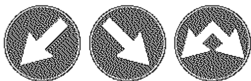
Fig. II 82/a/b e fig II 83 Art.122

Segnala cuspidi e testate di isole di traffico e spartitraffico poste entro la carreggiata. E' sempre accoppiato con i seguenti segnali indicanti i passaggi obbligatori o consentiti :