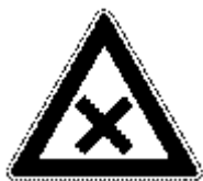
Figura II 40 Art. 109

Con la presente si specifica che il cartello: