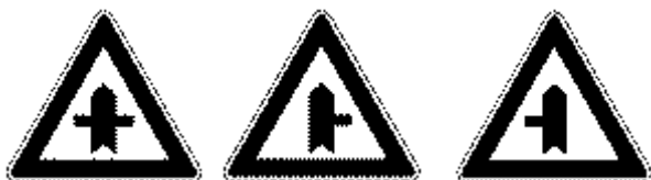
Figura II 43/a/b/c - Art. 112

Per presegnare una intersezione in cui il conducente ha diritto di precedenza bisogna usare, a seconda dei casi, uno dei seguenti cartelli: