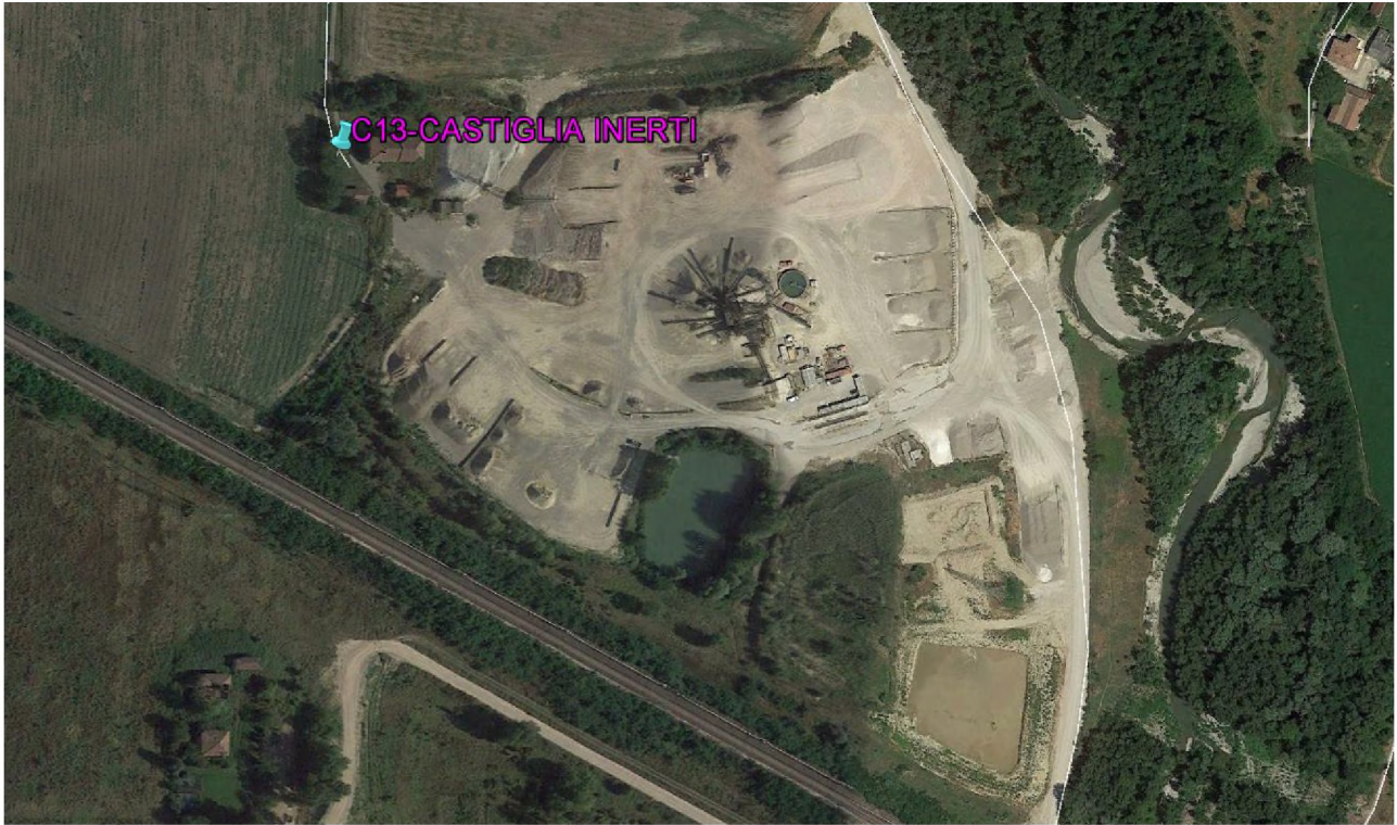
Stralcio fotografico da satellite dell'area di cava