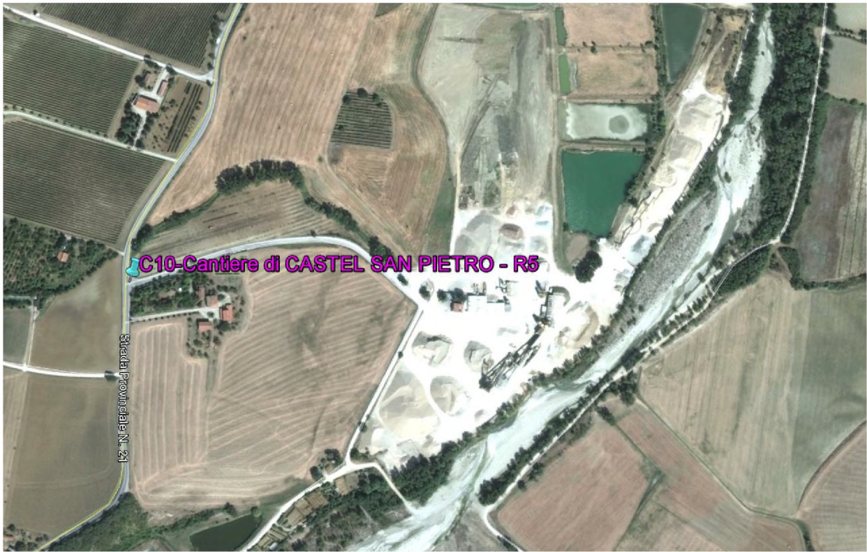
Stralcio fotografico da satellite dell'area di cava