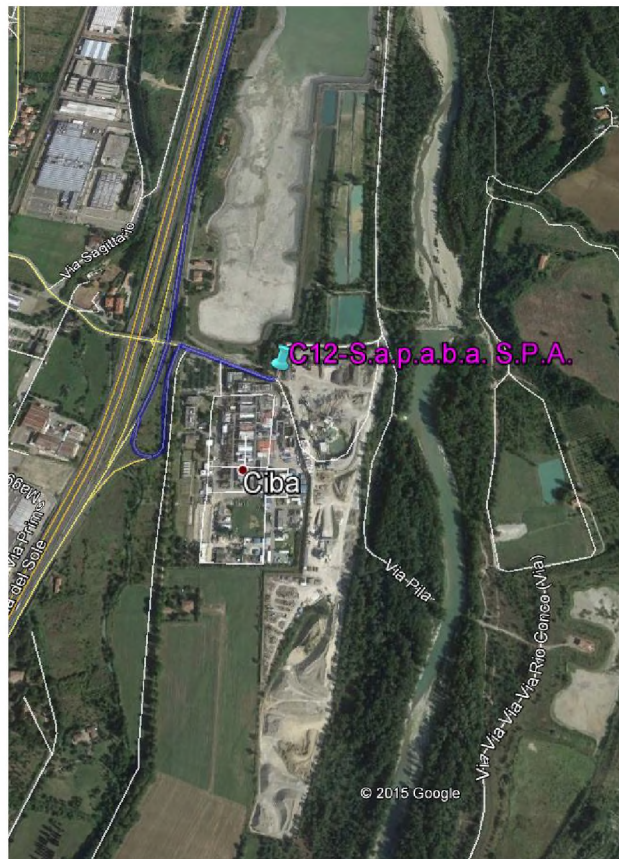
Stralcio fotografico da satellite dell'area di cava