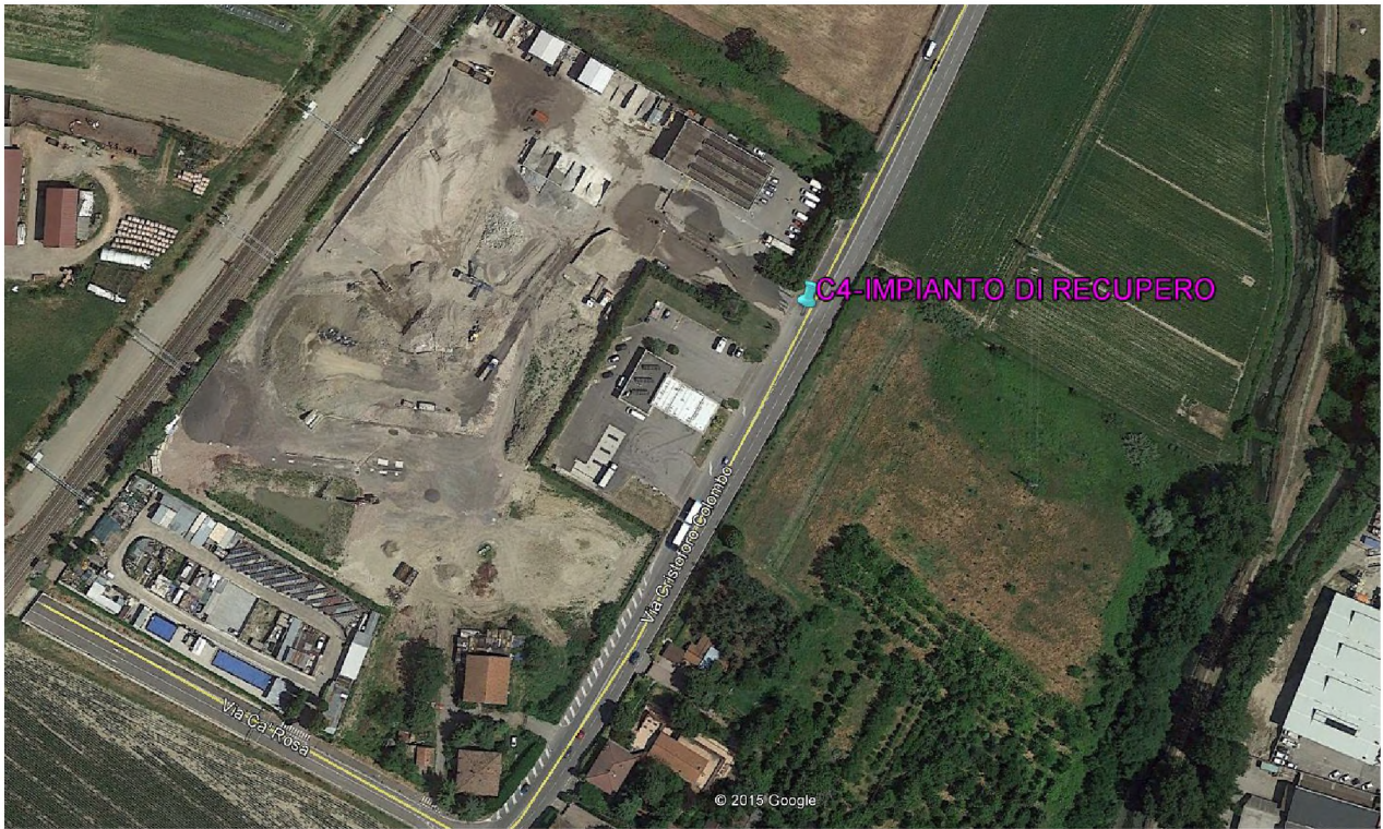
Stralcio fotografico da satellite dell'area di cava