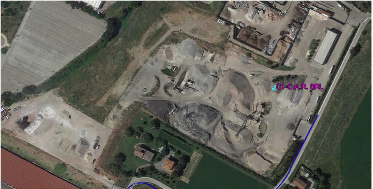
Stralcio fotografico da satellite dell'area di cava