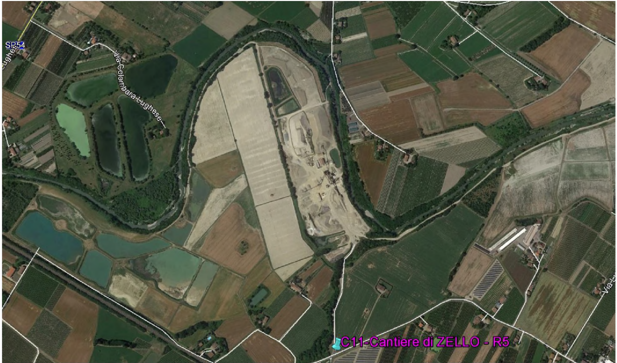
Stralcio fotografico da satellite dell'area di cava