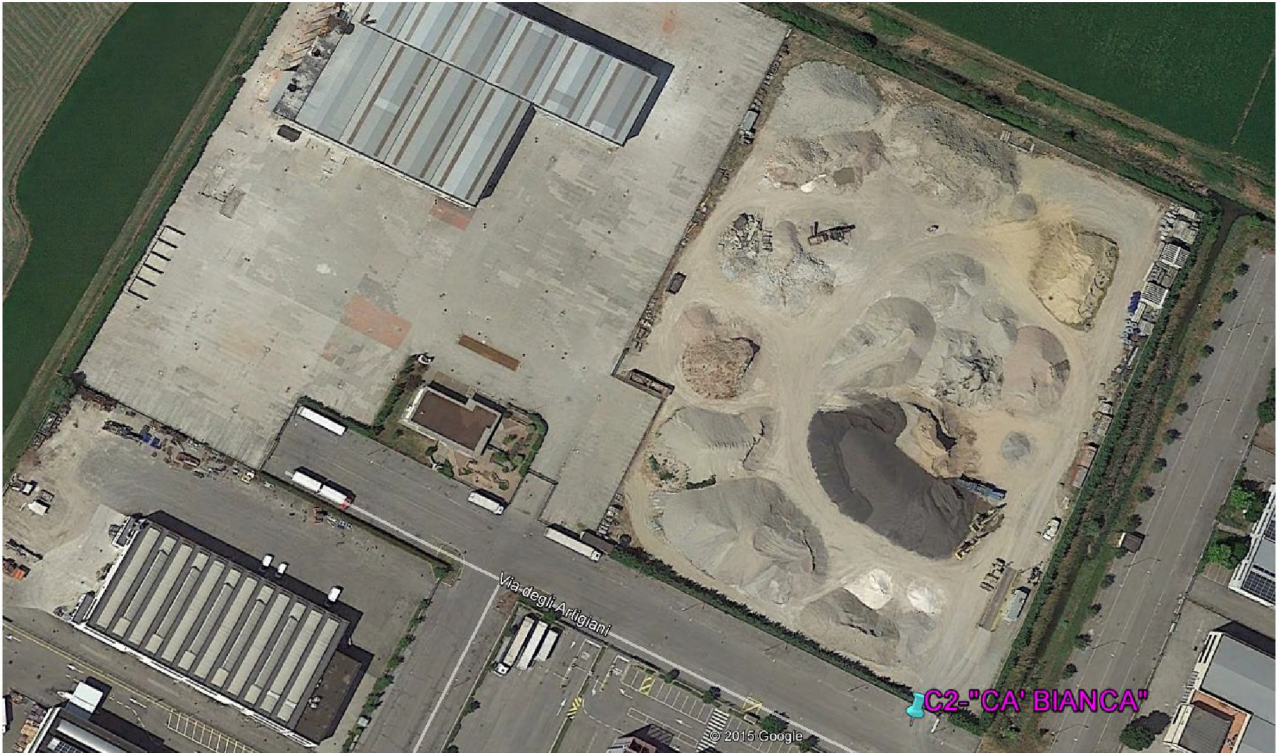
Stralcio fotografico da satellite dell'area di cava