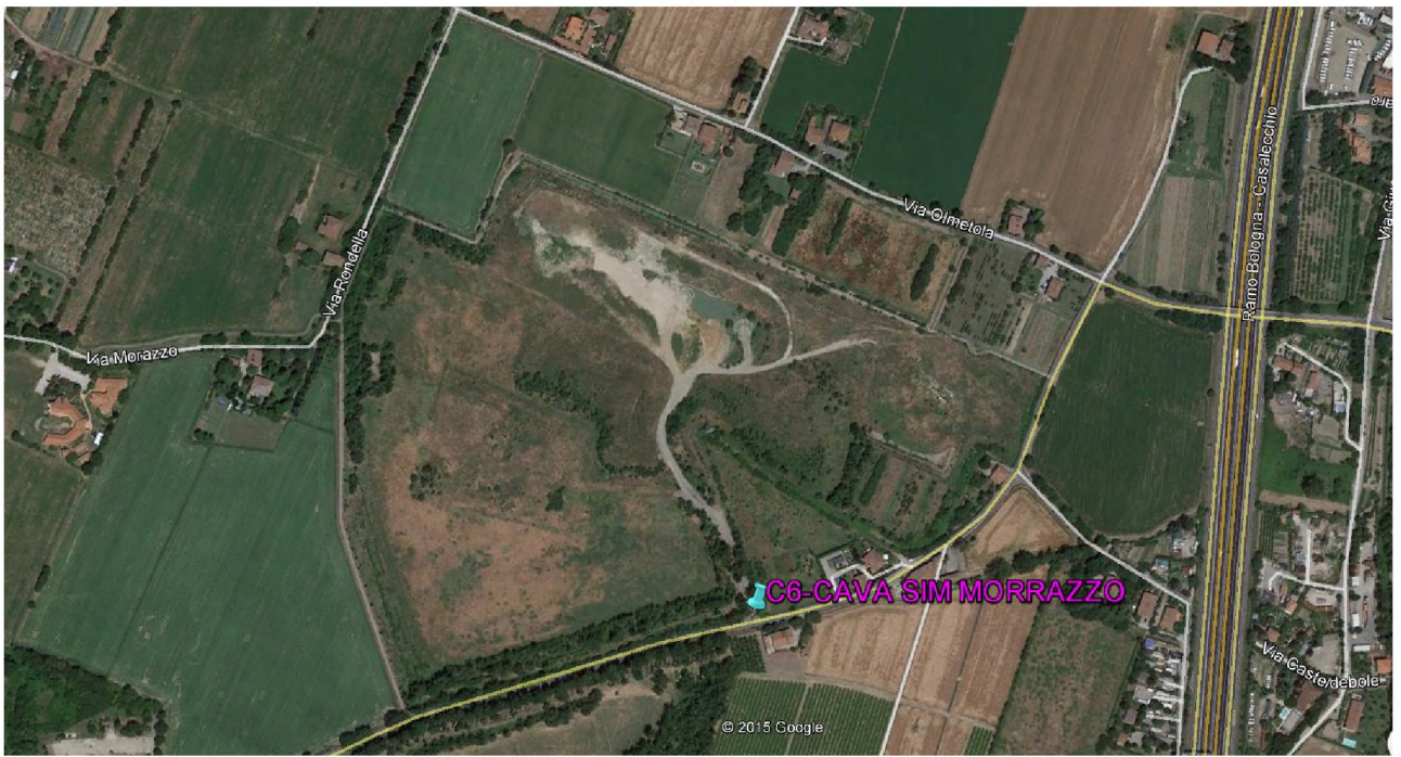
Stralcio fotografico da satellite dell'area di cava