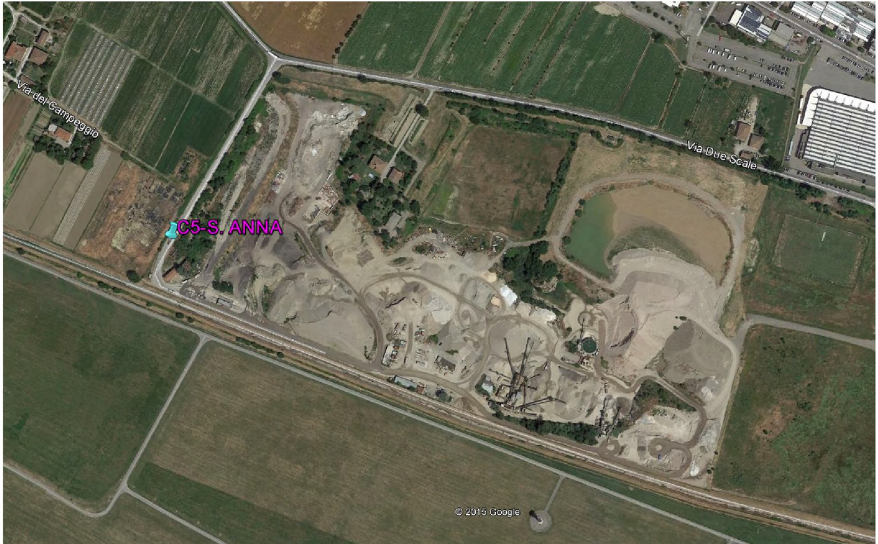
Stralcio fotografico da satellite dell'area di cava