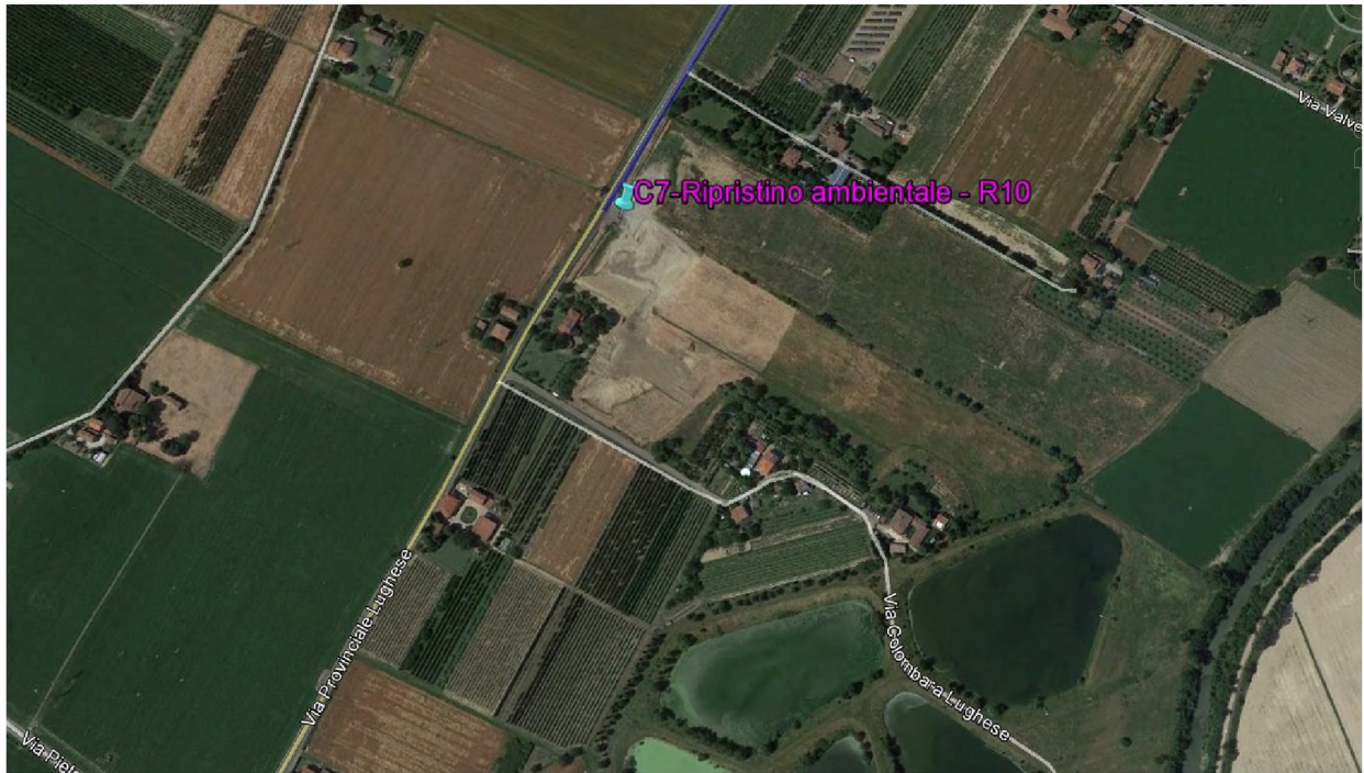
Stralcio fotografico da satellite dell'area di cava