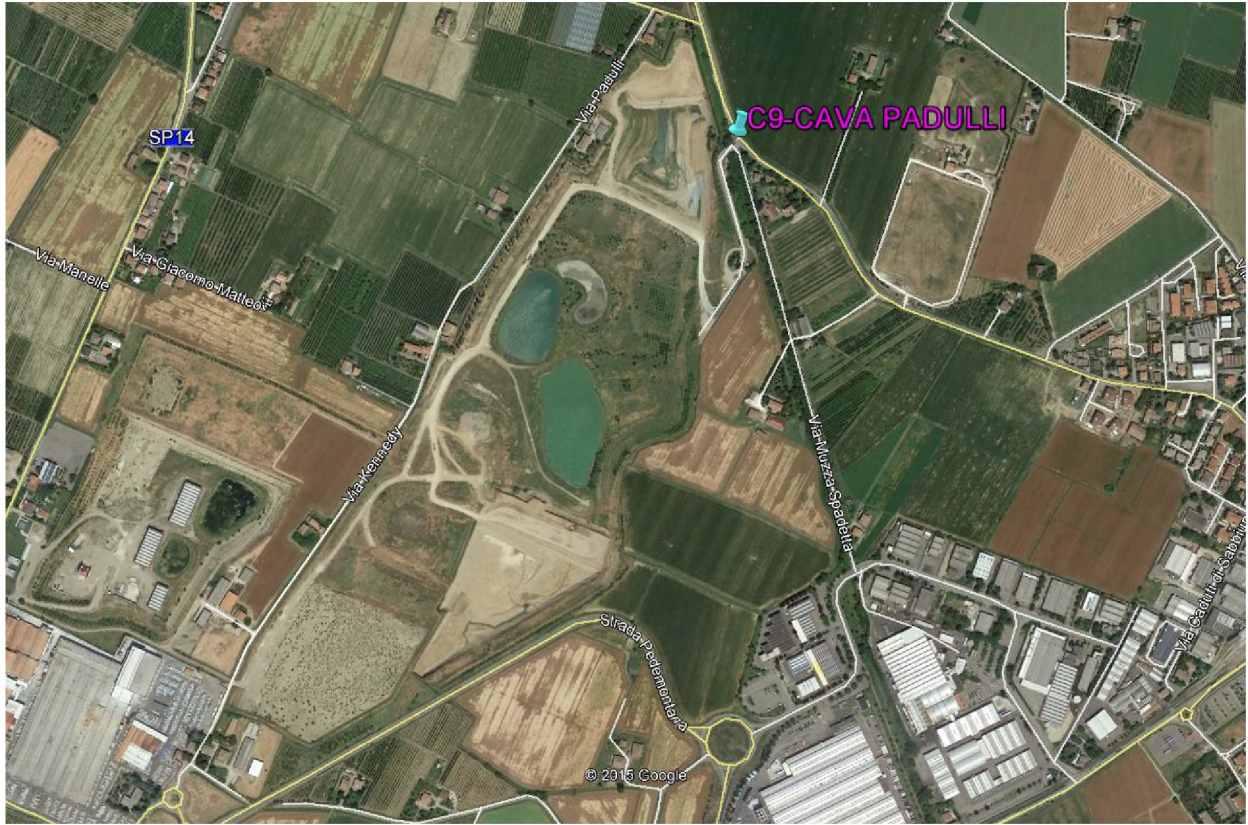
Stralcio fotografico da satellite dell'area di cava