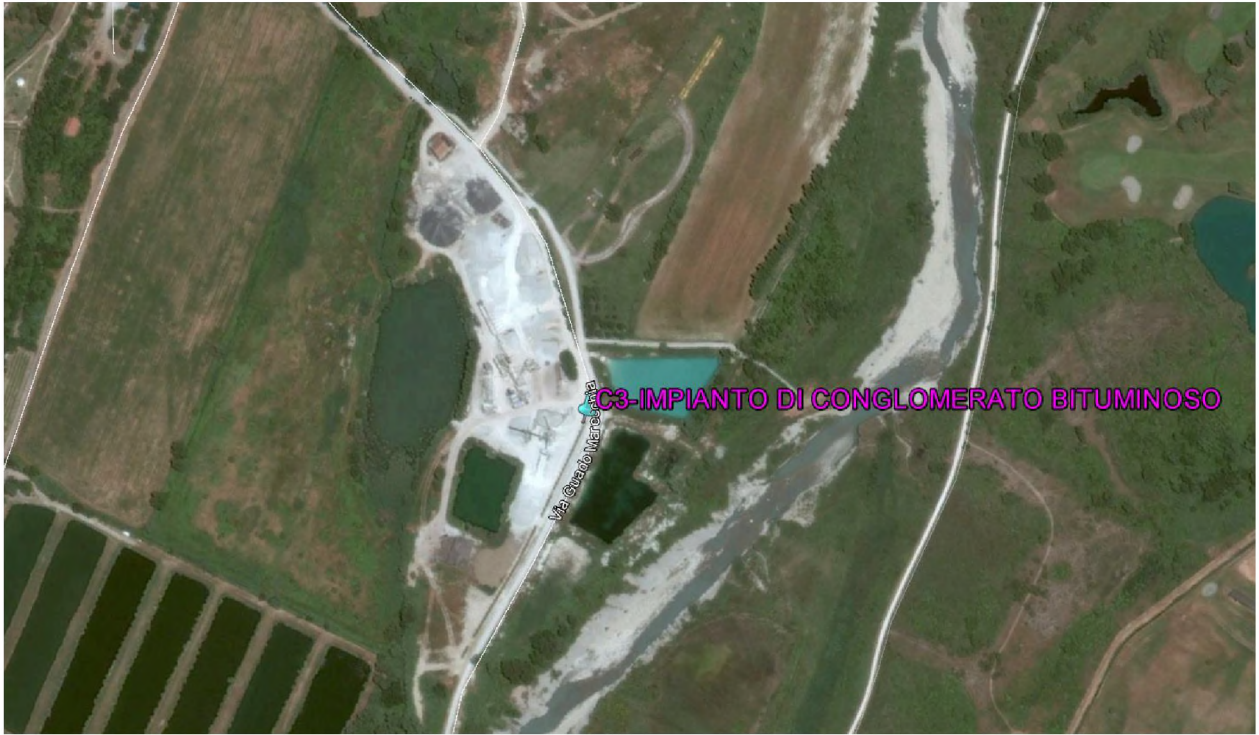
Stralcio fotografico da satellite dell'area di cava