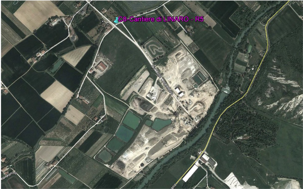
Stralcio fotografico da satellite dell'area di cava