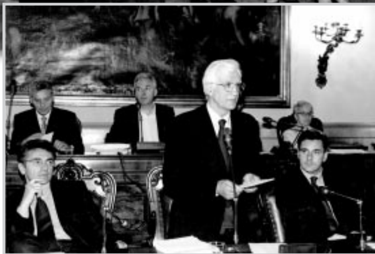
Un momento del giuramento del presidente davanti all'Assemblea riunita

È stato consigliere a Palazzo Malvezzi dal 1995 all'aprile del 1997, quando si è dimesso, ricoprendo la carica di capogruppo del suo partito.