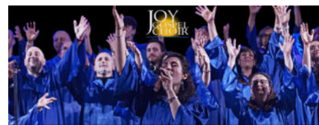
JOY GOSPEL CHOIR + special guest NORMAN SISTERS

Monteacuto delle Alpi (Lizzano in Belvedere), ore 21 Crystal Thomas Band