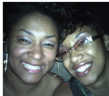
The Norman Sisters