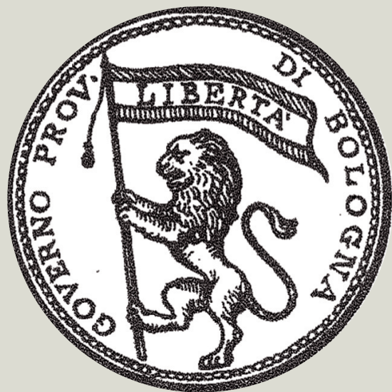
stemma del 1831