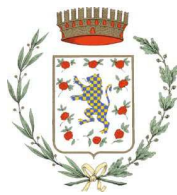
Comune di Marzabotto