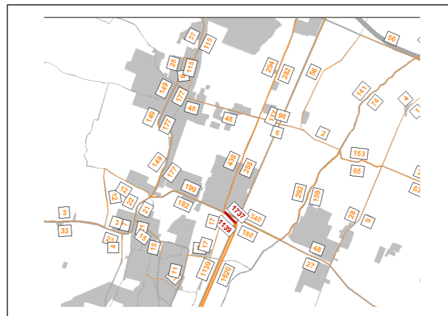
Svincolo A13 su Intermedia di Pianura