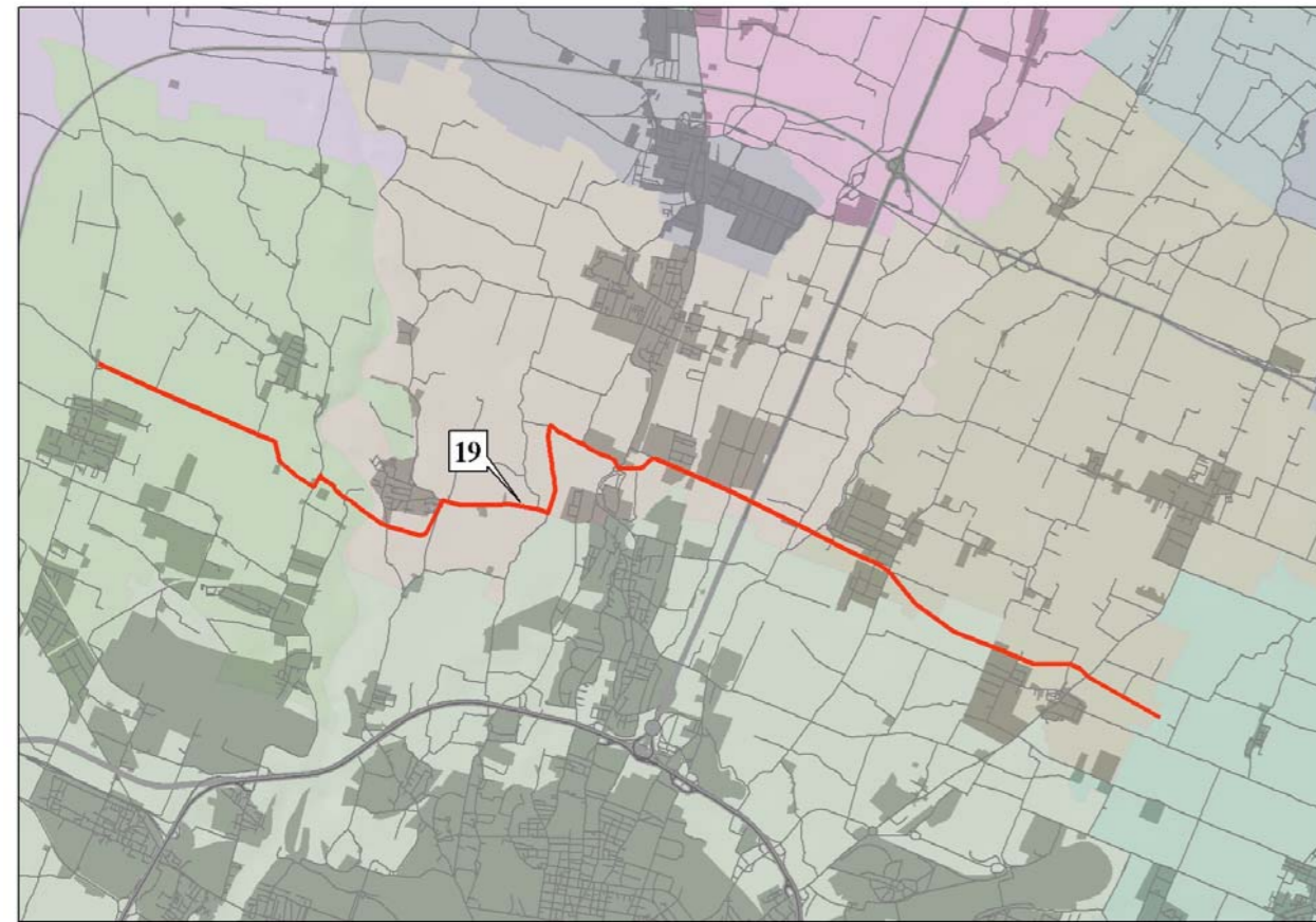
Individuazione planimetrica degli interventi

Gli interventi relativi alla configurazione infrastrutturale N°4 "Intermedia di Pianura" creano un nuovo asse di collegamento trasversale fra i Comuni di Calderara e Granarolo dell'Emilia attraverso interventi volti alla ricucitura di tracciati esistenti.