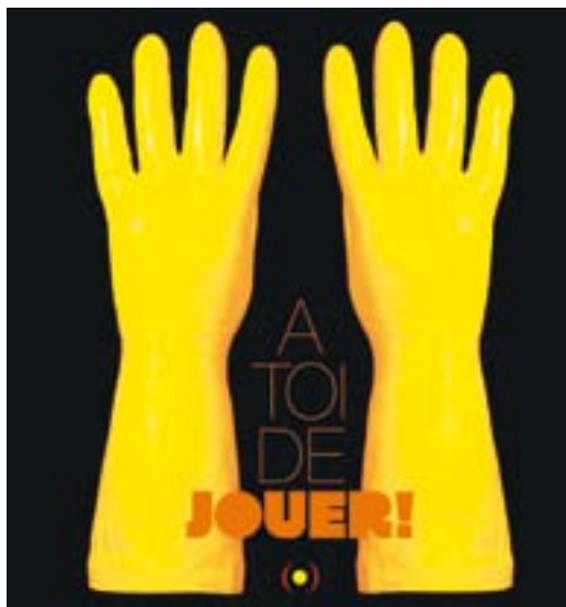
illustrazione di Claire Dé

Pochi colori: giallo e arancio. Qualche oggetto familiare: barattoli, colapasta, recipienti dalle più svariate forme... rigorosamente in plastica! Tutta la fantasia e la voglia di giocare necessari per osservare, combinare, costruire, trasformare, associare titoli ad oggetti d'arte, creare esposizioni e infine banchettare come in tutti i vernissage che si rispettano! Nella sua installazione Claire Dé sollecita i bambini a ritrovare e riconoscere, montare e smontare, inventare, sperimentare, muovendosi tra Dadaismo, Pop-Art, Nouveau Réalisme.