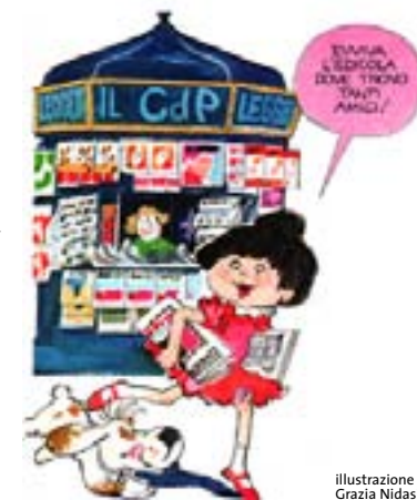
illustrazione di Grazia Nidasio

Laboratori e visite guidate a cura di Edizioni San Paolo, Franco Cosimo Panini editore e Accademia Drosselmeier. Su prenotazione