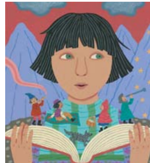
illustrazione di Jeanette Winter

Continuano gli incontri con scrittori, illustratori, attori, narratori nelle biblioteche comunali di pubblica lettura