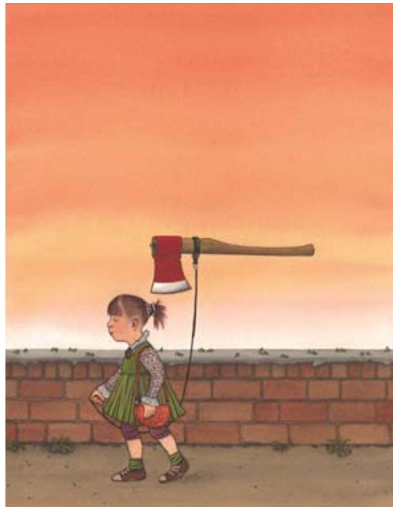
illustrazione di Nikolaus Heidelberg

promosso da Goethe-Institut ■ Bologna Children's Book Fair ■ con il patrocinio di Comune di Bologna ■ in collaborazione con Soprintendenza per i beni librari e documentari della Regione Emilia-Romagna ■ Biblioteca Salaborsa Ragazzi ■ Biblioteca Europea di Roma ■ mostra e catalogo a cura di Hamelin Associazione Culturale ■