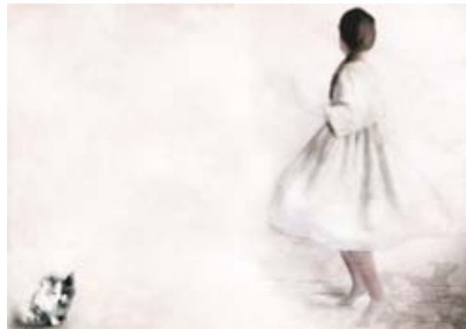
illustrazione di Sonia M.L. Possentini

L'autore Luigi Dal Cin incontra l'illustratrice Sonia M. L. Possentini e lo scrittore Alfredo Stoppa. Un appuntamento per grandi e piccoli sulla creazione di un libro illustrato.