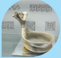
BUDRIO Museo Civico Archeologico e Paleoambientale "Elsa Silvestri"