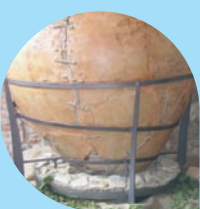
CASTELLO DI SERRAVALLE Ecomuseo della Collina e del Vino