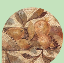
IMOLA Museo di San Domenico Strada romana glareata Rocca Sforzesca