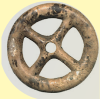
ANZOLA DELL'EMILIA Museo Archeologico Ambientale