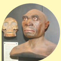
SAN LAZZARO DI SAVENA Museo della Preistoria "Luigi Donini" Grotta del Farneto-Parco dei Gessi