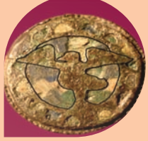
MEDICINA Museo Civico