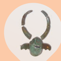
MONTERENZIO Museo Civico Archeologico "Luigi Fantini" Area archeologica del sito etrusco-celtico di Monte Bibele