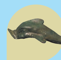
OZZANO DELL'EMILIA Museo della città romana di Claterna Area archeologica della città romana di Claterna