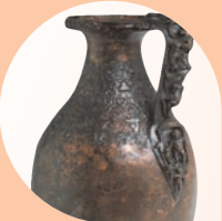
BAZZANO Museo Civico "Arsenio Crespellani"