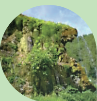
CASTEL D'AIANO Grotte di Labante