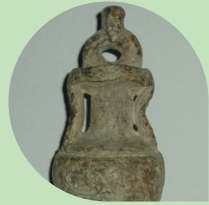
SAN GIOVANNI IN PERSICETO Museo Archeologico Ambientale