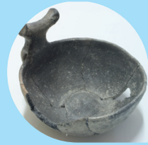
SANT'AGATA BOLOGNESE Museo Archeologico Ambientale