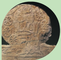
CASTENASO MuV Museo della Civiltà Villanoviana